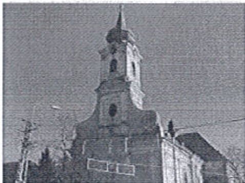
letöltés (1).jpg 7K