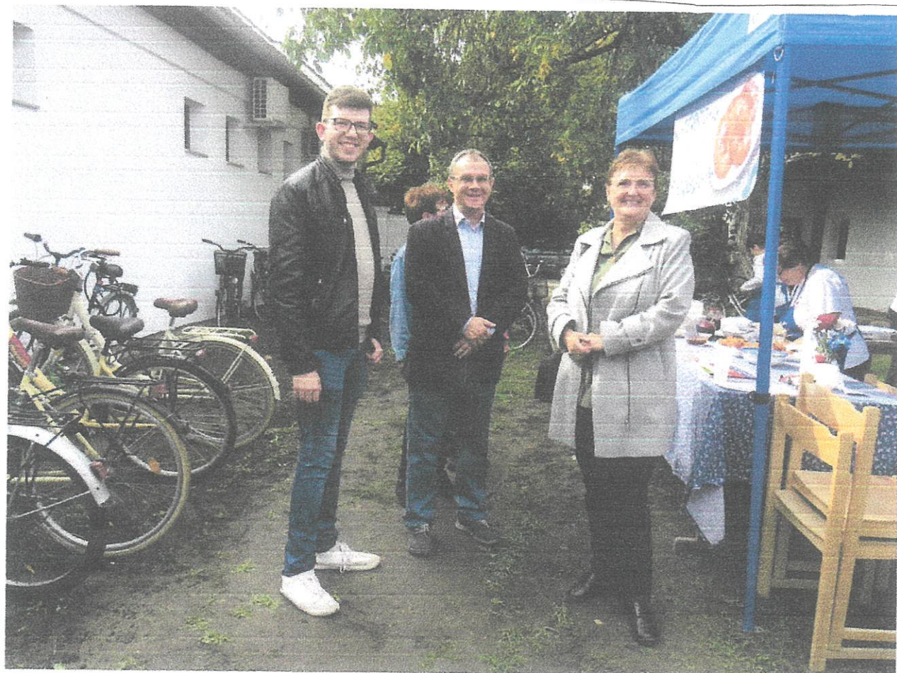
Békéscsaba Fánk sítés