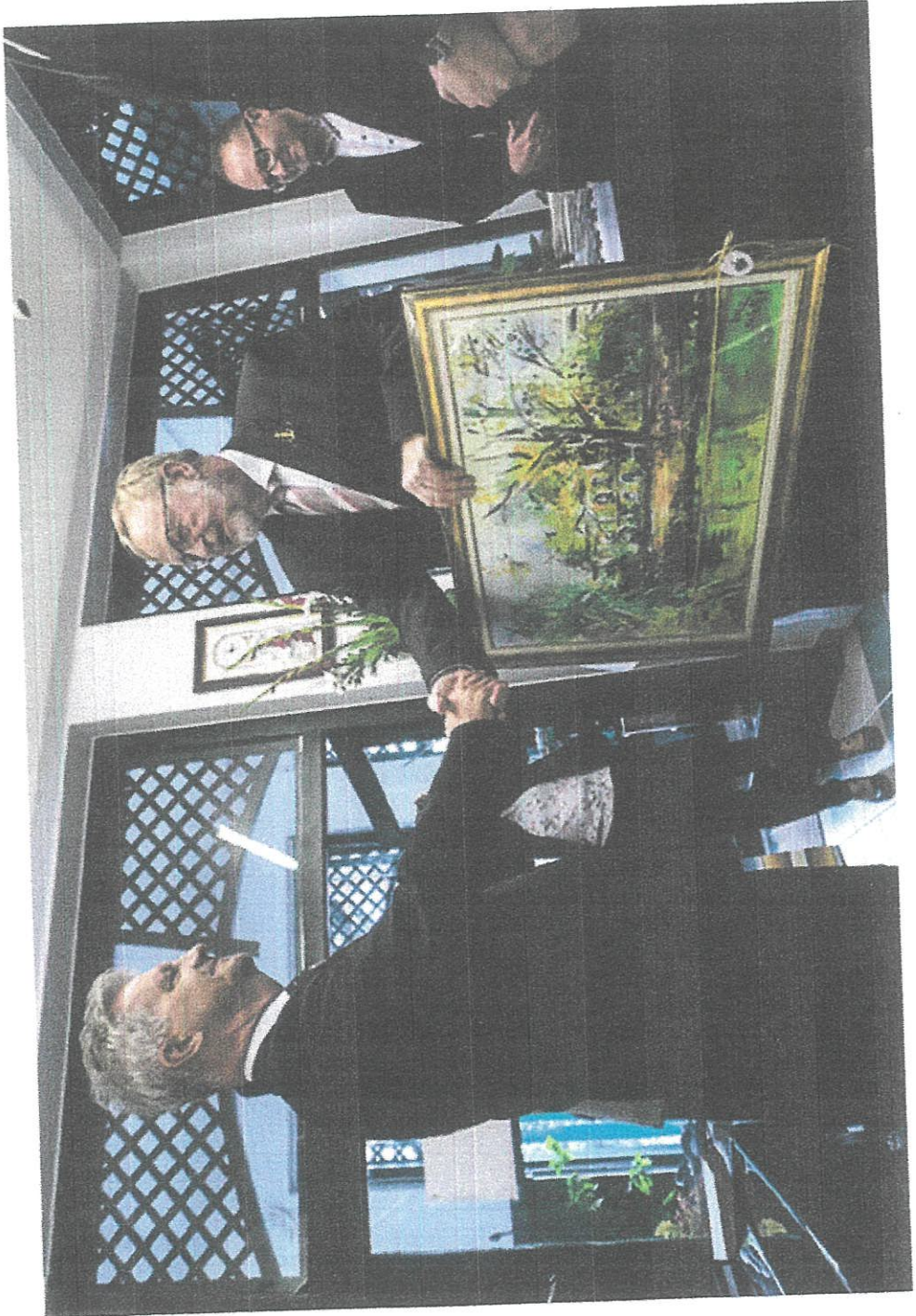
Fokuzul in bienestatojio