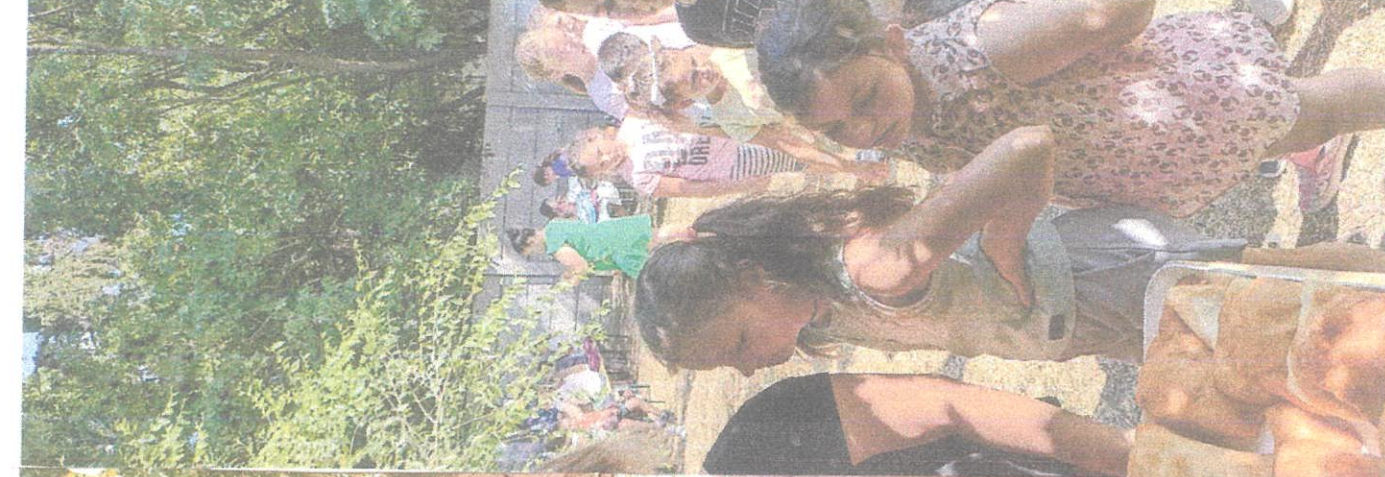
Каминин таборида болган