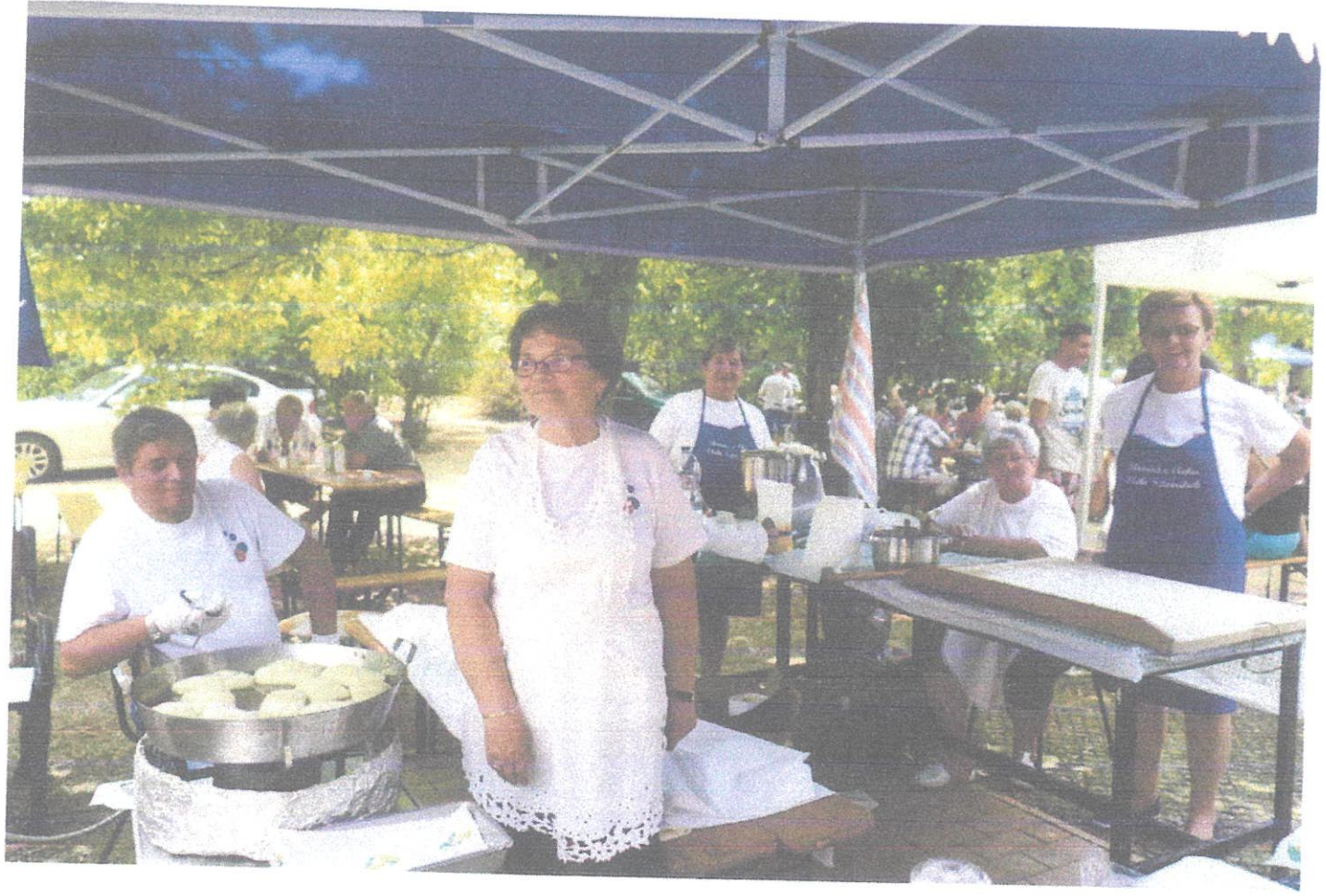
Mezäbrenyi Szervezet 30 éves ünnepsége