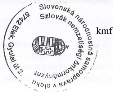
Bledáné Szilágyi Beáta Erika jegyzőkönyvHITELESÍTŐ