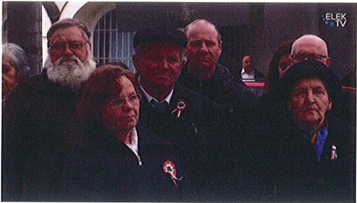
Március 15. városi megemlékezés, koszorúzás