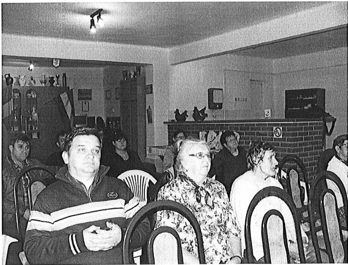
Eleki Román Nemzetiségi Önkormányzat közmeghallgatás