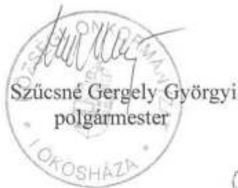
Szücsné Gergely Györgyi polgármester