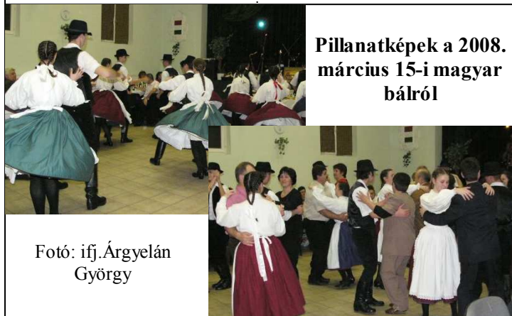
Pillanatképek a 2008. március 15-i magyar bálról